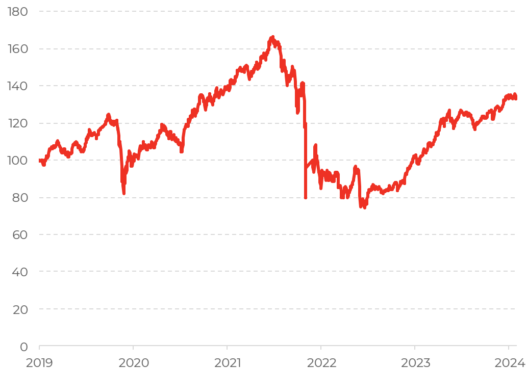
Динамика базового актива (Индекса МосБиржи) 2 , 2019-2024

Ключевым преимуществом Индекса 2 (перед отдельными акциями) является более низкая волатильность – даже если акции одной из компаний в составе Индекса 2 существенно снизятся, эффект на весь Индекс 2 может быть минимальным. Корпоративные риски у Индекса 2 также минимальны – например, он не может обанкротиться.